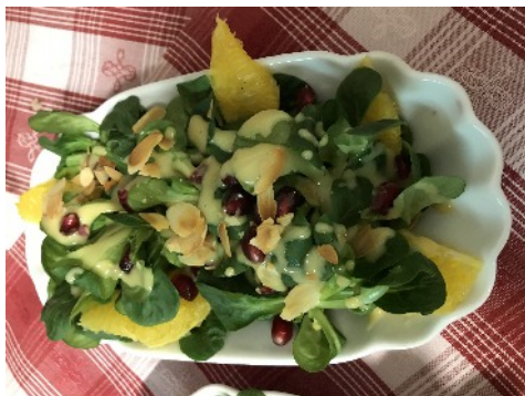
Feldsalat mit Orangenfilet, Granatapfelkerne, geröstete Mandelsplitter überzogen mit einem Walnuss-Honig dressing.