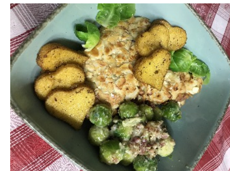
Hähnchenbrust im Vanille-Mandelmantel mit Rosenkohl und Polentaherzen.

Abgerundet mit einer Sauce Bearnaise Der Nachtisch bleibt eine Überraschung !