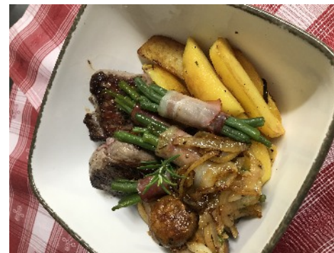
Argentinisches Roastbeef vom Angusrind, mit frischen Champignons und Zwiebeln, Kartoffelspalten und Bohnenbündchen.