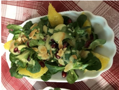
Feldsalat mit Orangenfilet, Granatapfelkerne, geröstete Mandelsplitter überzogen mit einem Walnuss-Honigdressing.