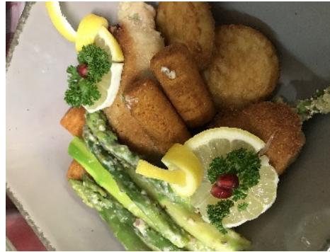
Paniertes Schweinerückensteak, gefüllt mit Schinken, grünem Spargel und Bergkäse, dazu Kroketten und Kartoffelrösti's