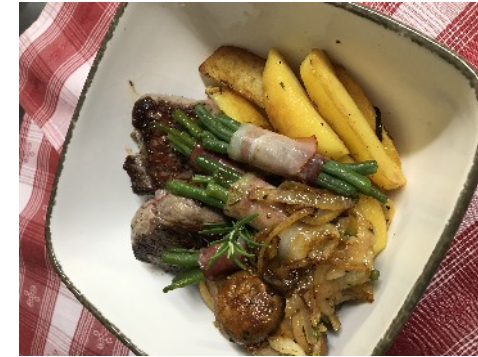
Argentinisches Roastbeef vom Angusrind, mit frischen Champignons und Zwiebeln, Kartoffelspalten und Bohnenbündchen.

Abgerundet mit einer Sauce Hollandaise Der Nachtisch bleibt eine Überraschung !